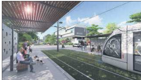
Ce projet de 450 M€ fait depuis hier l'objet d'une présentation au grand public par la Cinor.