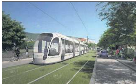
TAO sera doté de dix-huit stations espacées en moyenne de 500 mètres chacune.