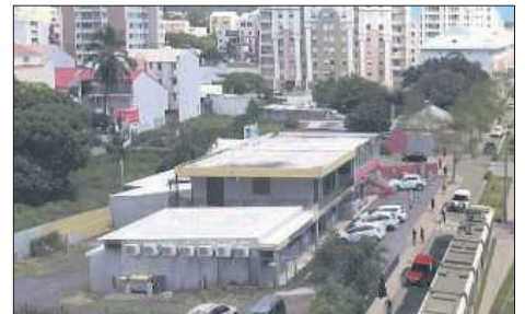
Selon la Cinor, le chantier du futur tramway ne devrait pas prendre plus de deux ans.