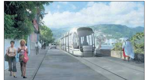
Le tracé de la ligne passe par la rue Lucien-Gasparin.